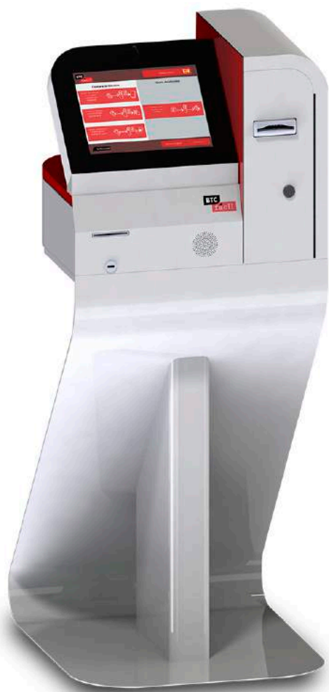
BTC Fácil B01