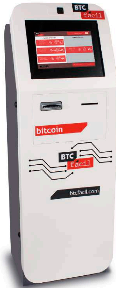
BTC Fácil E01